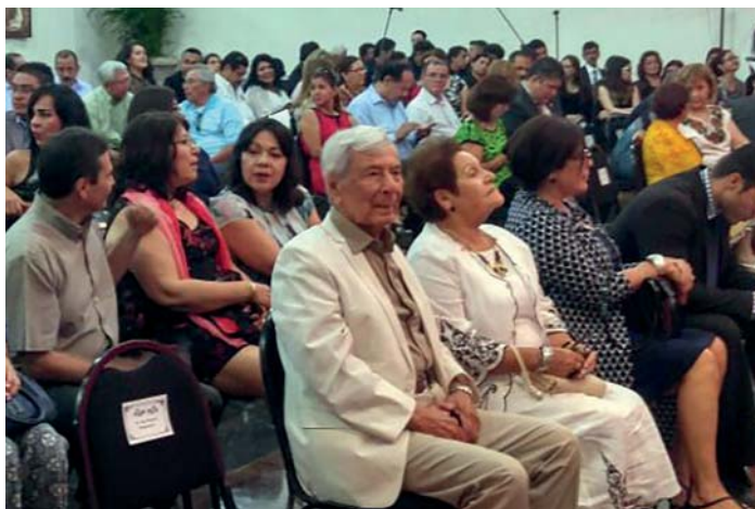
Familiares y amigos asistentes al evento.

La frontera tiene, como todo, dos puntos de vista válidos: nos une o nos separa. Quienes suelen ser pesimistas dicen que la frontera nos separa irremediamente. Quienes son optimistas —y la academia lo es por naturaleza— ven en la frontera un área de oportunidad para obtener información que suele ofrecernos explicaciones claras a nuestro ser y estar de este lado, y como podemos entender de mejor manera las relaciones bilaterales para obtener provecho de ello.