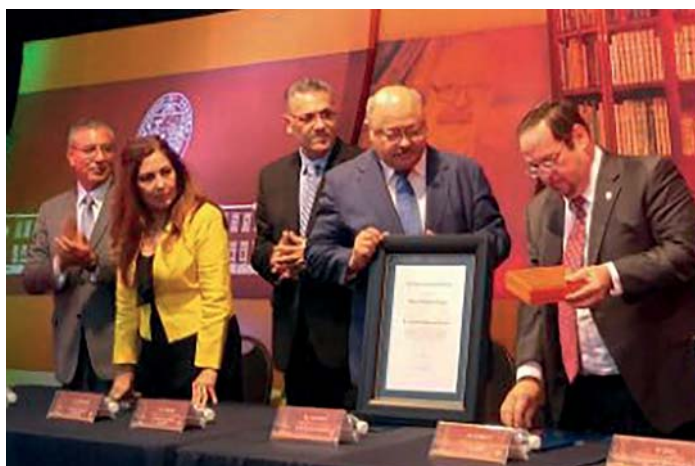
Momento en que el rector de la Unison entrega el reconocimiento y la medalla Honoris Causa.